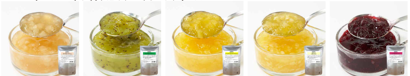
ホワイトピーチジュレ